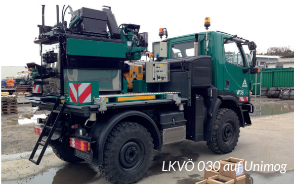
LKVÖ 030 auf Unimog