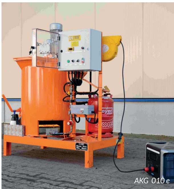
AKG 010 e

Schlaglöcher, Netzrisse und Spurrillen sind nicht nur ärgerlich, sondern stellen auch ein erhebliches Sicherheitsrisiko dar. Eine schnelle und dauerhafte Instandsetzung ist daher unerlässlich. Mit unseren Maschinen für die Verarbeitung von Heißmischgut lassen sich beschädigte Fahrbahnbeläge effizient und nachhaltig reparieren. Ob punktuelle Ausbesserungen oder großflächige Sanierungen – unsere Technik sorgt für eine sichere, schnelle und qualitativ hochwertige Aufbereitung des Mischgut.